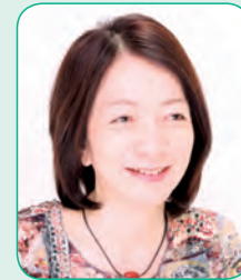
有限会社ビーイングサポート・マナ